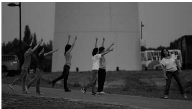
'In Girum Imus Nocte et Consumimur Igni' tijdens Kortrijk Congé 2009

Leren bewegingen maken, leren creëren, daar was het llythya dan ook om te doen. "De improvisaties hadden ook een praktische reden. Als je een kant en klaar stuk wil aanleren dan duurt het een tijdje voor de dansers jouw bewegingstaal onder de knie hebben en tien dagen was daarvoor te kort. Maar los daarvan, en veel belangrijker nog, wou ik de jongeren vertrouwen bijbrengen om actief mee te stappen in een creatief proces."