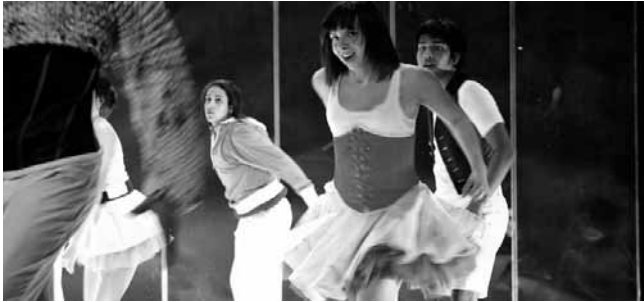
FABULEUS-productie 'Gender Blender'